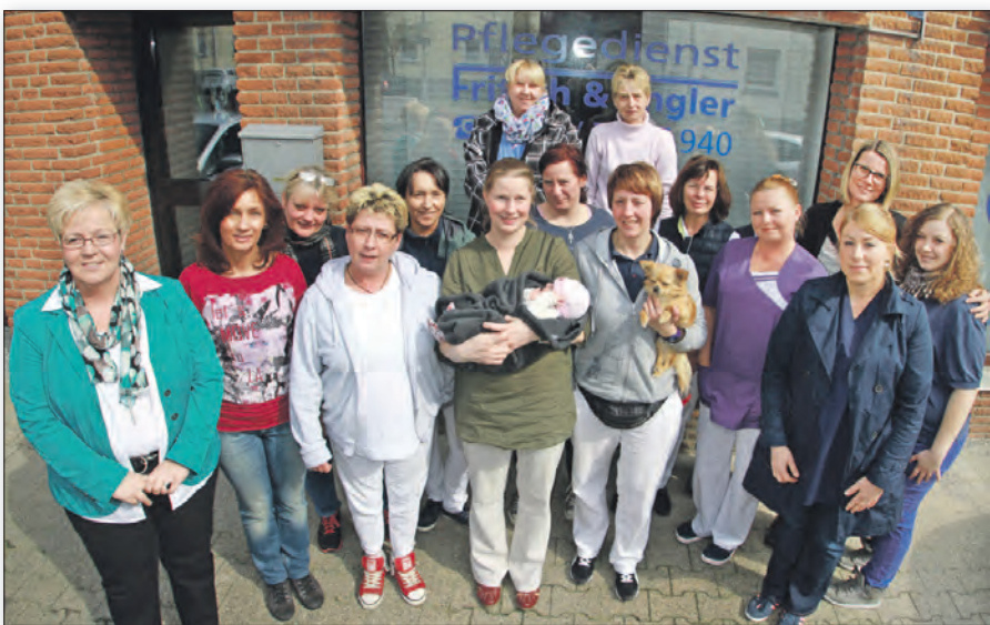
Das Team von Fritsch und Engler bei der Teambesprechung in familiärer Atmosphäre. Mit dabei sind sogar Baby und Hund von Mitarbeiterinnen.